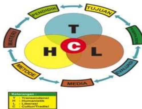
Koneksitas dalam Paradigma Pembelajaran Profetik

Paradigma pembelajaran profetik bisa dijelaskan dalam konsepsi sinar culture (C) yang benderang memancar dan sekaligus bergerak atau aktif. Sinar culture (C) tersebut berada di tengah. Konsepsi T, H, dan L yang merupakan komponen pendidikan yang mengitarinya, juga bercahaya dan bergerak dinamis. Alasan bercahaya dan bergerak itu menunjukkan bahwa paradigma pembelajaran profetik senantiasa bergerak, dinamis, dan aktif menerangi manusia dan alam semesta.