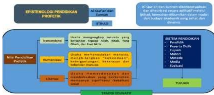
Gambar 4 Epistemologi Paradigma Pembelajaran Profetik

Paradigma pembelajaran profetik menjadikan Al-Quran dan Al-Hadis atau Sunnah sebagai sumber kajian, kemudian dikonseptualisasi dan diteorisasi melalui ijtihad, serta disinergikan dengan kitab-kitab klasik serta hasil penelitian kontemporer, lalu dibumikan, diinternalisasikan, atau diimplementasikan dalam budaya akademik yang sehat dan dinamis.