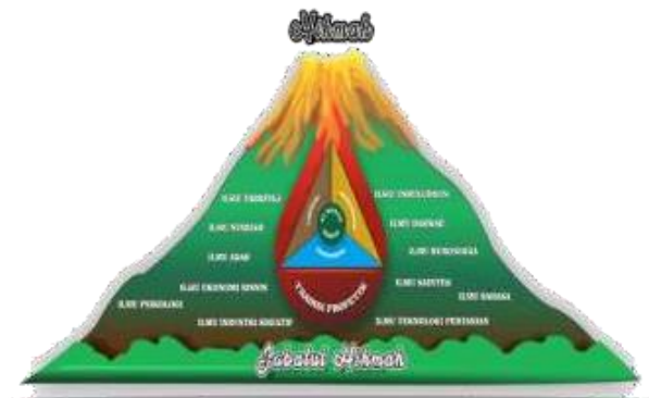
Gambar 1 Konstruksi Paradigma Keilmuan Jabalul Hikmah

Perkembangan teknologi, pergerakan zaman, serta keterbukaan akses dan komunikasi yang begitu masif seperti sekarang membutuhkan basis yang kuat. Oleh karena itu, paradigma keilmuan Jabalul Hikmah memproyeksikan aksi nyata aktual-visioner yang berpijak pada penguatan batin, ketajaman analisis, optimalisasi potensi lokal, serta pengembangan kebudayaan nusantara. Konsep ini menemukan titik aksentuasinya dengan “puncak gunung” bernama hikmah.